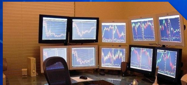
Unidad de Mentefactura