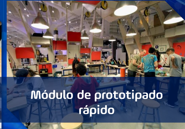
Módulo de prototipado rápido