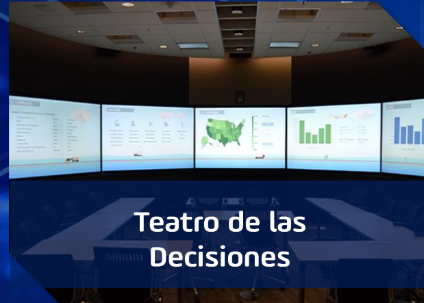
Teatro de las Decisiones