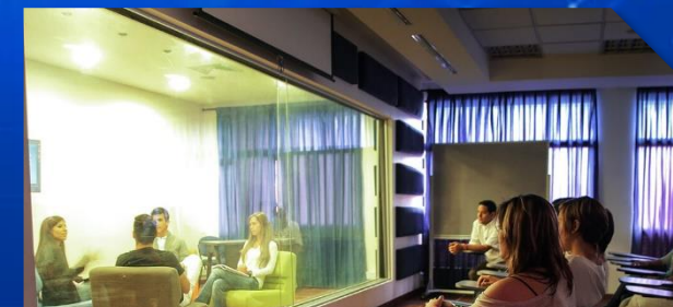
Laboratorio Ciencias del Comportamiento