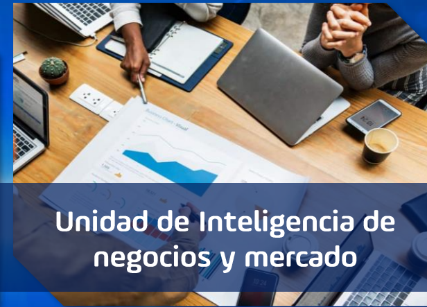
Unidad de Inteligencia de negocios y mercado