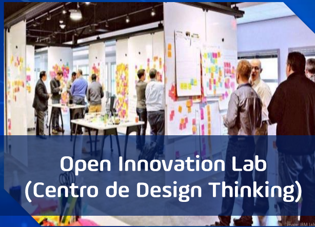
Open Innovation Lab (Centro de Design Thinking)